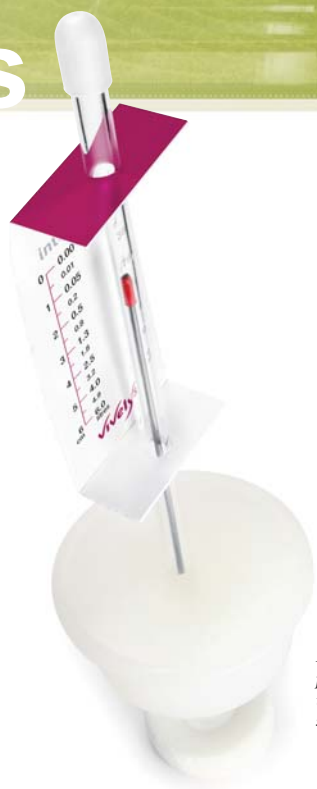
La Bonde Intelligente procure aux éleveurs de vin un moyen de contrôle supplémentaire.

En général, on la remplit au maximum. Pourtant, il y a une relation évidente entre la qualité du vin, le volume d'air et la surface de contact entre air et vin. La Bonde Intelligente procure aux éleveurs de vin un moyen de contrôle supplémentaire.